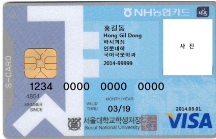
< 앞 면 >