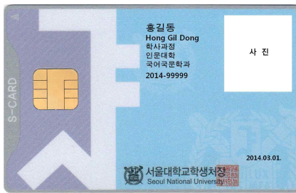
< 앞 면 >