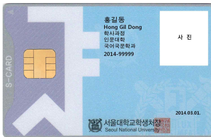
< 앞 면 >